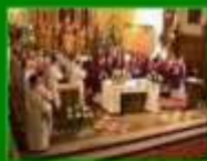
Pogrzeb k.p. ks. A. Poręby