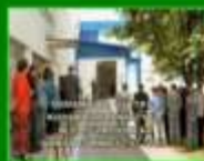
Nowe kostiumy "Zambranka"